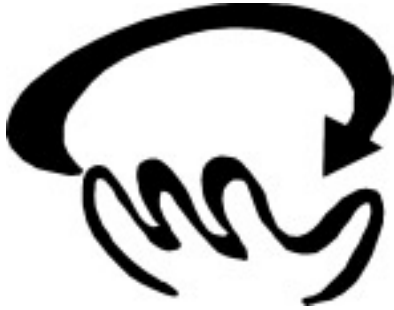
CUADRO 1 Versión (Blanco y negro y negativo)